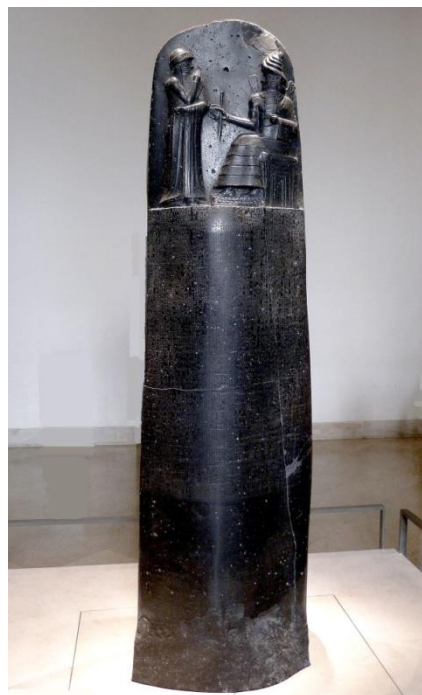
Código de Hammurabi (Museo del Louvre, París)

Se trata de un conjunto de leyes esculpidas en estelas de piedra que fueron repartidas por las capitales del imperio.